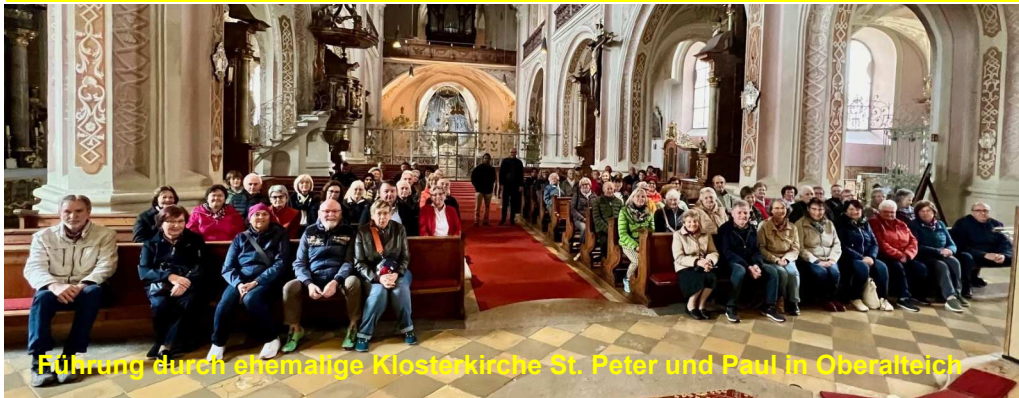
Führung durch ehemalige Klosterkirche St. Peter und Paul in Oberalteich