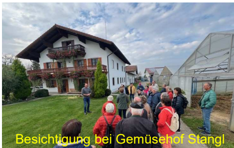
Besichtigung bei Gemüsehof Stangl