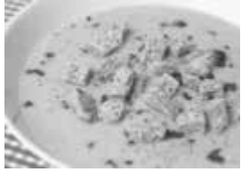
Kartoffelsuppe mit Brot

Am Sonntag, den 22.03.2026 nach dem Gottesdienst im Pfarrsaal in Bühl