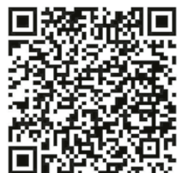
Hier gehts zum Online-Kirchweinkalender