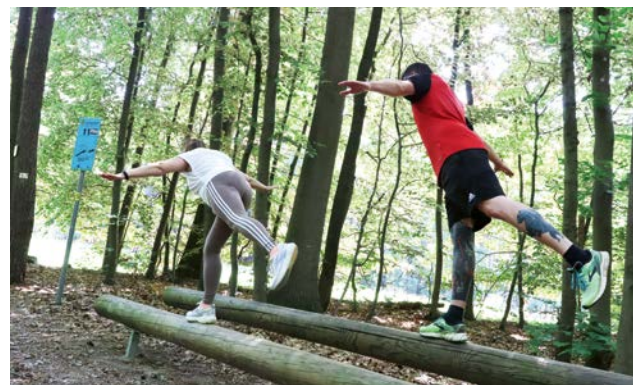
Das Redaktionsteam hat den Trimm-Dich-Pfad für die Leserinnen und Leser des „#durchblicks“ getestet.