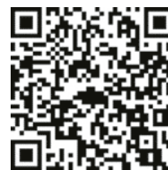
QR-Code Anmeldung zur Landrad(t)s-Tour

In Scheinfeld erhalten die Radlerinnen und Radler erste Einblicke in das neue Naturparkzentrum und erfahren mehr über die regionale Natur- und Umweltschutzarbeit. Unterwegs lädt ein gemütlicher Biergarten zur Einkehr ein. Anmeldung über den nebenstehenden QR-Code.