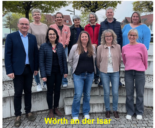
Würth an der Isar