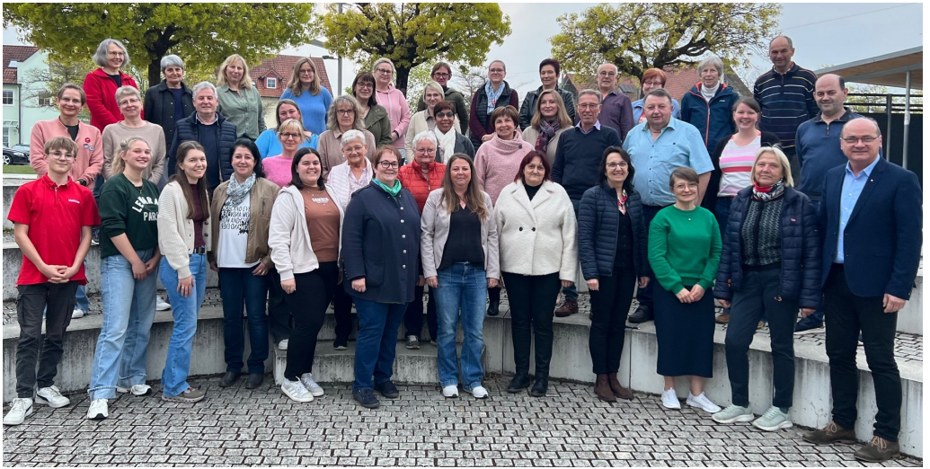
Der neue Gesamtpfarrgemeinderat besteht aus 40 Mitgliedern, 32 gewählten und acht berufenen Frauen und Männern. Konstituierende Sitzung war am 15.4.2026.