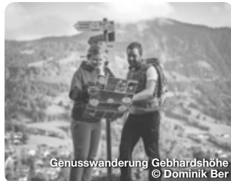
Genusswanderung Gebhardshöhe

Der Große Alpsee in Bühl ist der größte Natursee im Allgäu und ist ein MUSS bei dem Besuch der Stadt Immenstadt. Der See erstreckt sich von West nach Ost mit gut 3 km Länge, von Nord nach Süd mit fast 1 km Breite und einer max. Tiefe von 22 m. Immenstadt im Allgäu