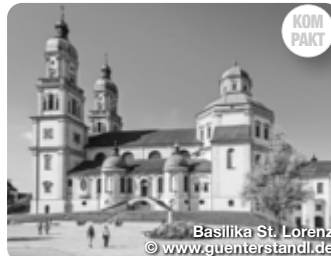
Basilika St. Lorenz

Rund 800 Tiere werden ab 9:00 Uhr zurück ins Tal und durch die Stadt auf den Scheidplatz (Viehmarktplatz) getrieben. Traditionell wird jede Alpe von einem Schildträger (mit dem Namen der Alpe) angeführt.