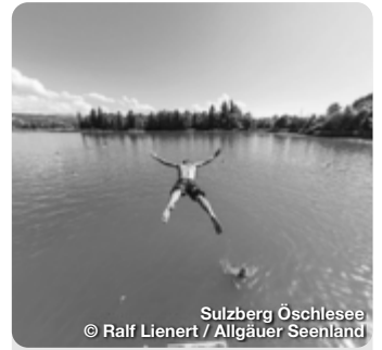
Sulzberg Öschlesee