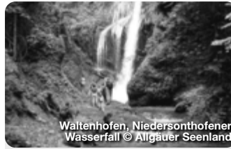
Waltenhofen, Niedersonthofener Wasserfall