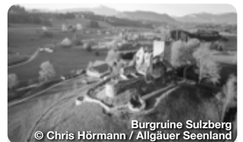
Burgruine Sulzberg

Die Stadt Kempten lädt zu einem historischen Fest unter dem Titel „Der Große Kauf“ ein, das auf der Burghalde und im Altstadtspark gefeiert wird. Anlass ist das 500-jährige Gedenken an den Bauernkrieg und das historische Ereignis des Großen Kaufs im Jahr 1525.