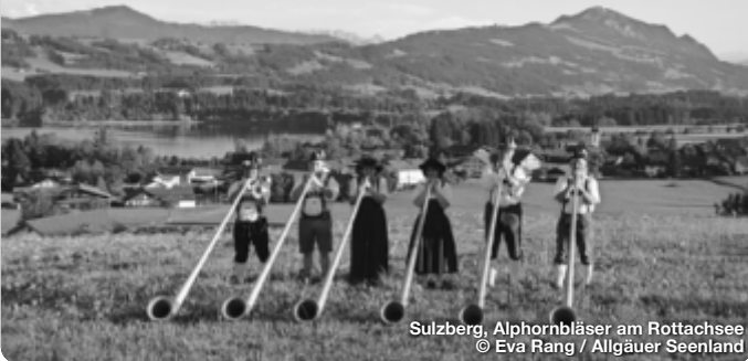
Sulzberg, Alphornbläser am Rottachsee

Der Landkreis Oberallgäu, im Süden Bayerns gelegen, ist ein wahres Paradies für Naturliebhaber und Erholungssuchende. Geprägt von einer atemberaubenden Alpenkulisse, bietet die Region zahlreiche Möglichkeiten für Outdoor-Aktivitäten wie Wandern, Skifahren und Mountainbiken. Besonders beeindruckend sind die Allgäuer Alpen mit dem bekannten Nebelhorn und dem idyllischen Alpsee. Kulturell Interessierte kommen in charmanten Städten wie Oberstdorf und Immenstadt auf ihre Kosten, wo traditionelle bayerische Architektur und gastfreundliche Menschen den besonderen Charme des Allgäus ausmachen. Auch Wellness und Entspannung werden großgeschrieben, etwa in den zahlreichen Thermen und Kurorten. TreffpunktDeutschland.de/tourismus-region