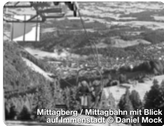
Mittagberg / Mittagbahn mit Blick auf Immenstadt