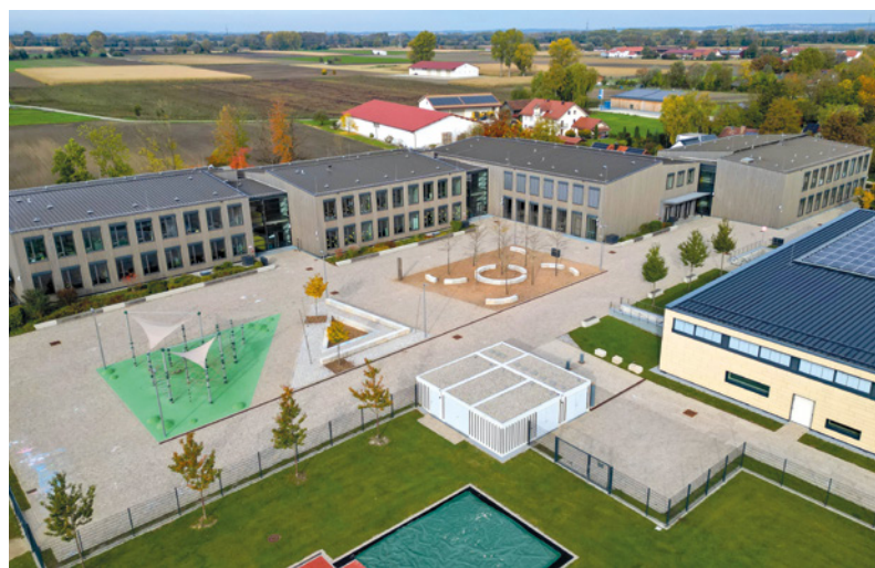
Grund- und Mittelschule Oberding (2025)