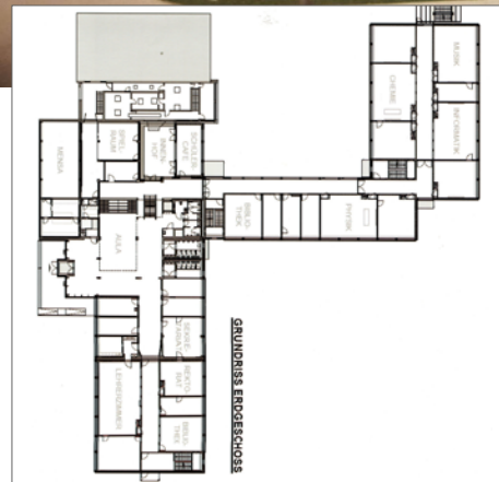
Grundriss Erdgeschoss mit Anbau