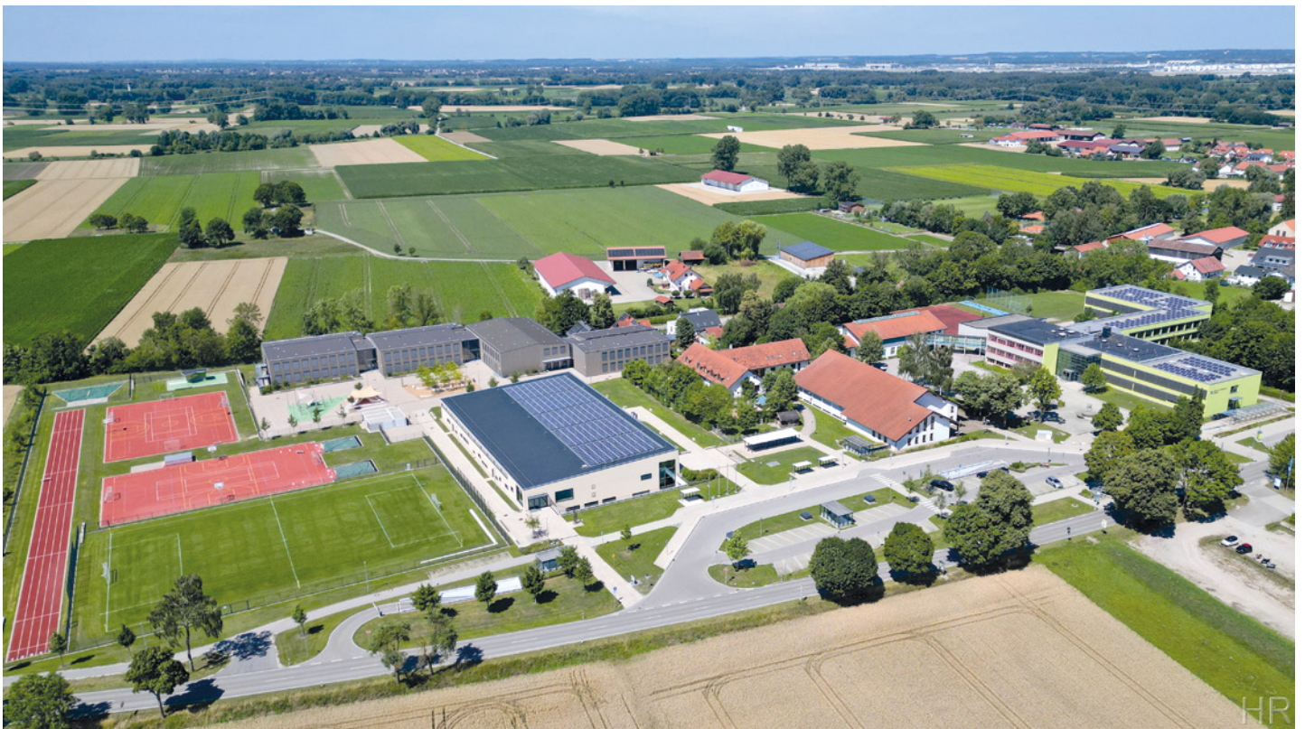
Luftaufnahmen Schulzentrum Oberding (2025)