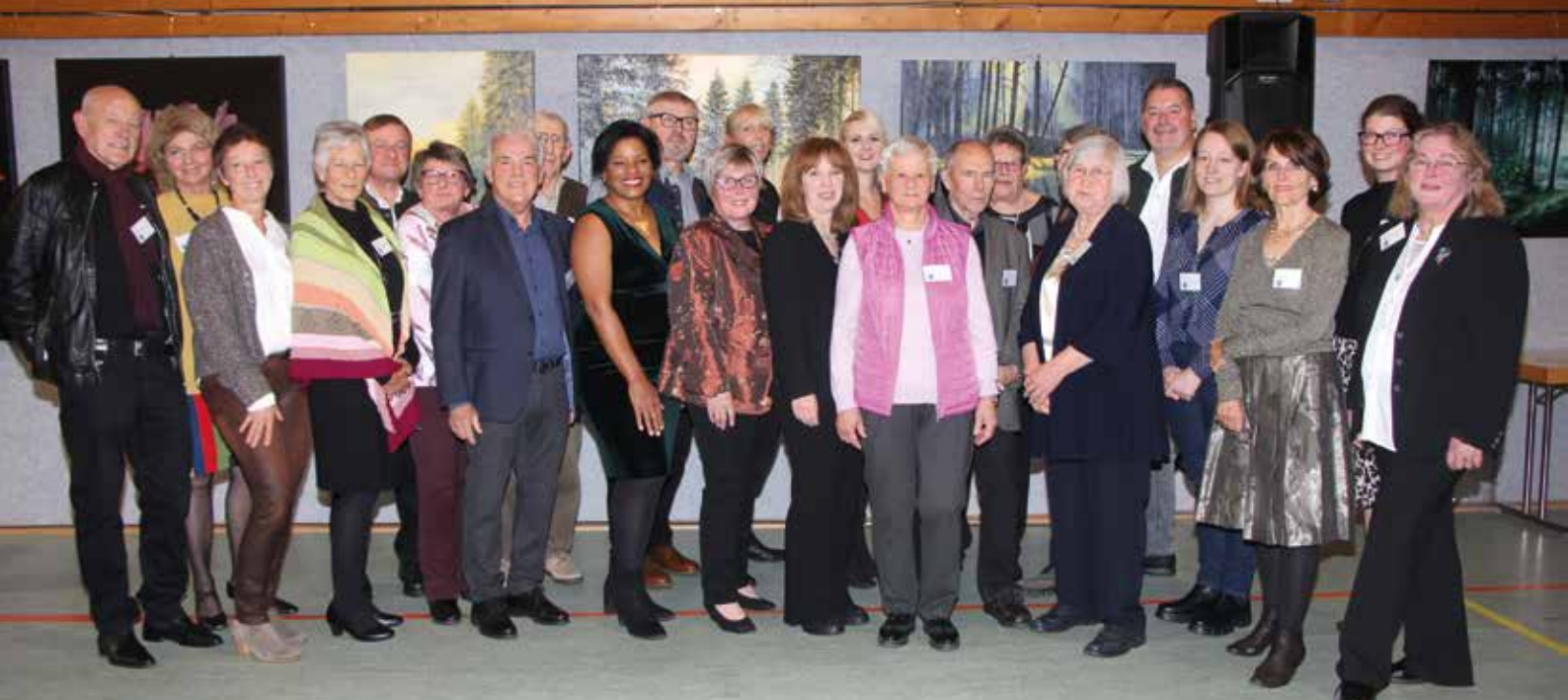
Oberdinger Künstler und Mitwirkende bei der Vernissage