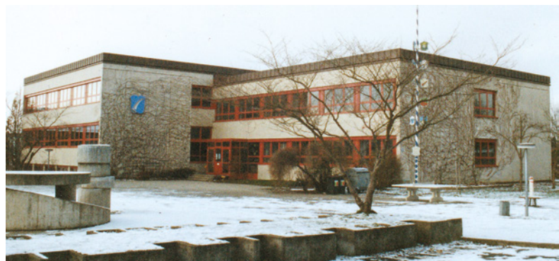
Zentralschulhaus Oberding nach der ersten Renovierung (1995)