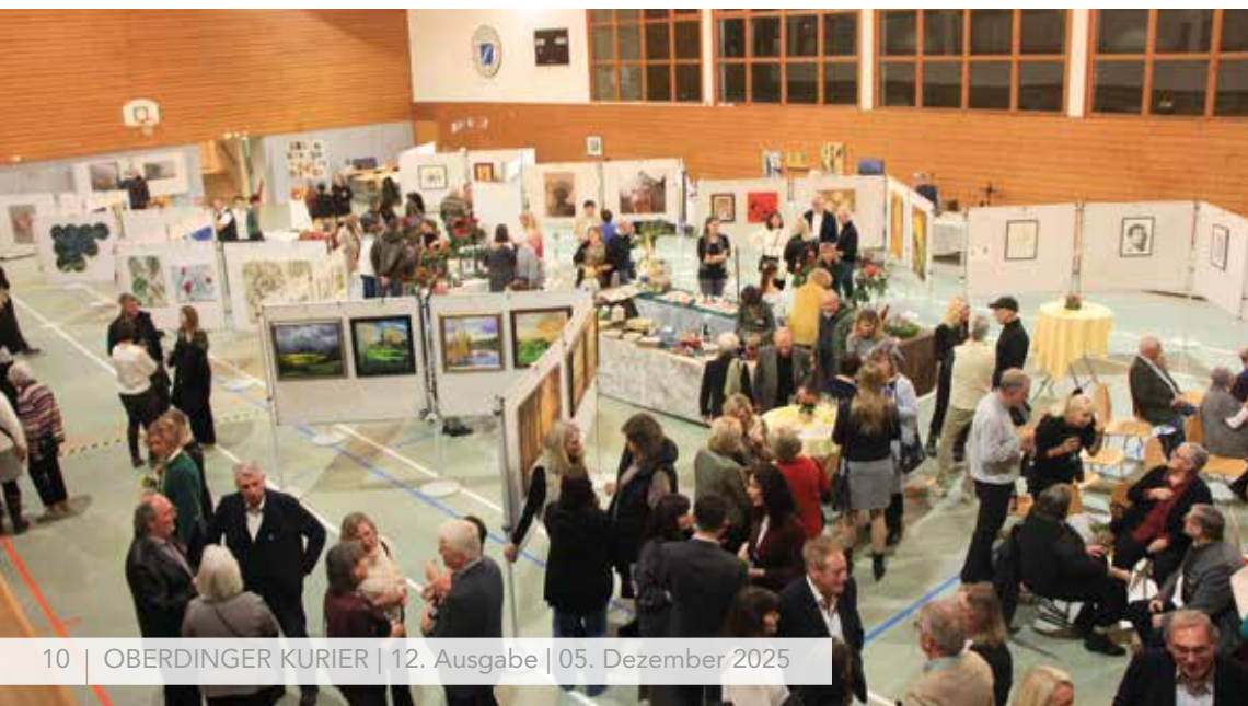
Anziehungspunkt für viele Gäste – die Oberdinger Kunstausstellung in der Mehrzweckhalle

Großes Interesse fand auch die Fotoausstellung, die in einem gesonderten Raum im Erdgeschoß untergebracht war. Reinhard Heuer hatte auf