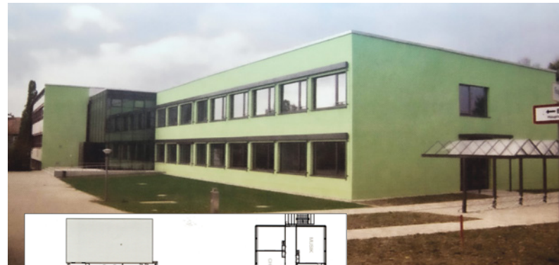
Außenansicht Grund- u. Hauptschule (2010)