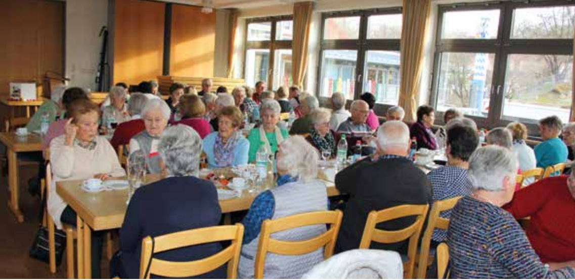
Kein Platz blieb frei beim Seniorennachmittag in Notzing.