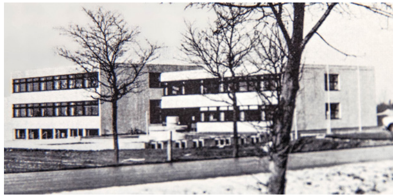
Zentralschulhaus Oberding im Jahr der Errichtung (1972)