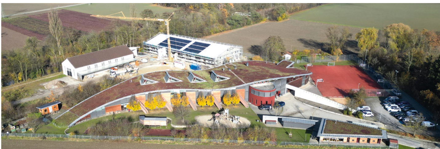
Montessorischule Aufkirchen (2025). Im Hintergrund die Baustelle des neuen Bauhofs.

Der Ordnung halber muss erwähnt werden, dass das Schulwesen in der Schulgemeinde Oberding, mit der Ansiedlung der Montessorischule Erding in Aufkirchen durch ein alternatives Erziehungs- und Bildungswesen ergänzt wurde. Zum Schuljahresbeginn 2004 konnte das Schulhaus bezogen werden.