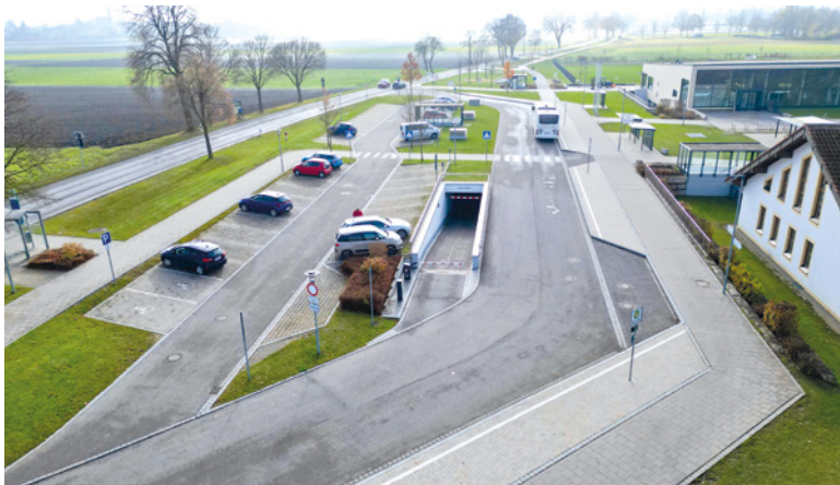
Zufahrt Tiefgarage, PKW-Stellplätze und Schulbushaltestellen (2025)

Im Zusammenhang mit dem Bau der Dreifachsporthalle wurde auch eine Tiefgarage mit 105 Stellplätzen sowie 48 oberirdischen Stellplätzen und Schulbushaltestellen errichtet.