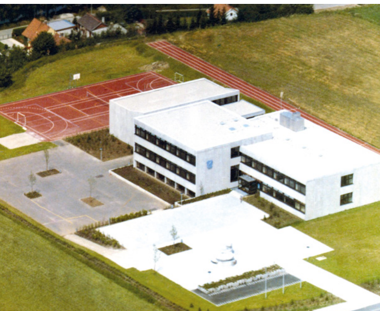
Luftbild vom Zentralschulhaus Oberding im Jahr der Errichtung (1972)

Zur notwendigen Erweiterung der Sportmöglichkeiten für die Grund- und Teilhauptschule I, wurde 1992 eine Sporthalle errichtet, die neben der sportlichen Nutzung durch Schulen und Vereine, auch andere Möglichkeiten eröffnete wie z.B. Bürgerbälle, Kunstlerausstellungen, Neujahrsempfänge, usw.