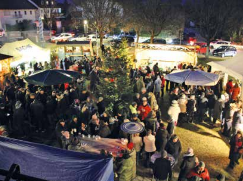
Winterzauber mit vielen Gästen