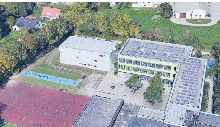
Containeranlage (ca. 2020)

Um Platz für den Ausbau der Realschule und die Grund- und Mittelschule zu bekommen, wurden vorübergehend Schul-Container aufgestellt.