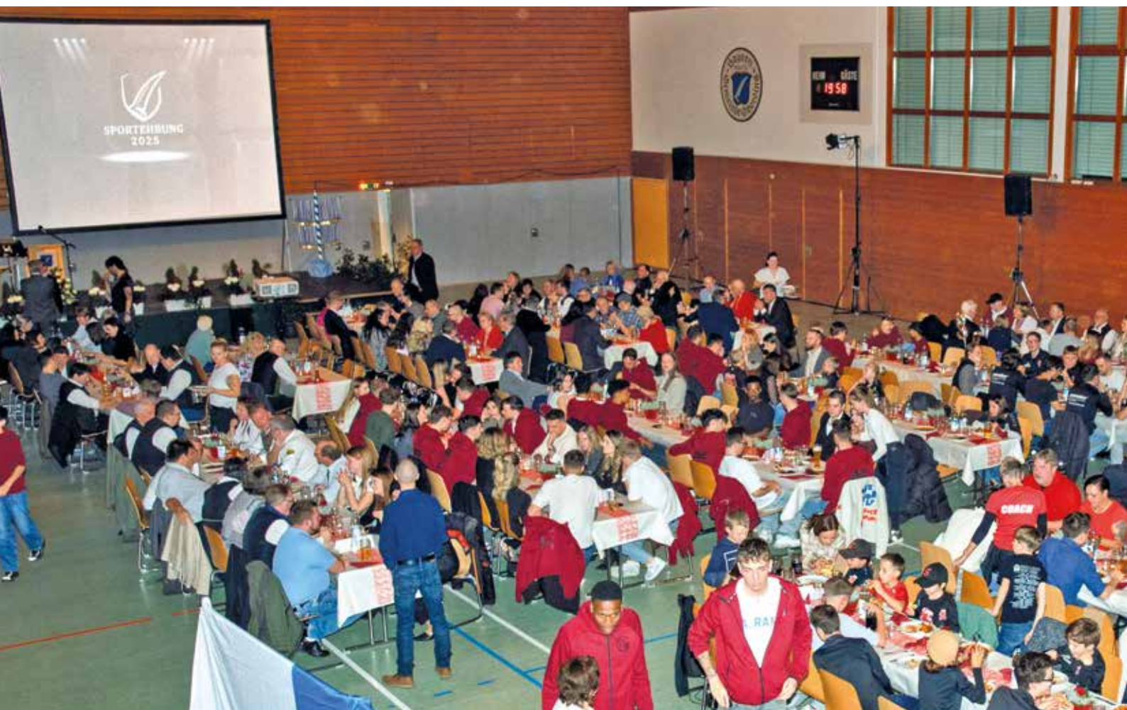
300 geladene Gäste feierten gemeinsam die Ehrung der erfolgreichen Sportlerinnen und Sportler der Gemeinde Oberding

Medaillen, Ehrennadeln und Urkunden für verdiente Sportler und Funktionäre