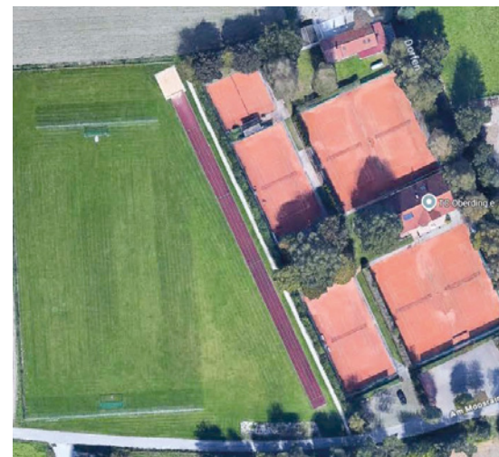
Interims-Freisportanlage Am Moosrain neben der Tennisanlage (2025)

Um auch den sportlichen Anforderungen einer Grund- und Hauptschule gerecht zu werden, wurde neben der Tennisanlage an der Straße Am Moosrain eine Interims-Freisportanlage mit großem Spielfeld, einer 100m-Laufbahn sowie Weitspringgruben angelegt. Die 300 m Entfernung zur Schule konnte man über die Straße am Moosrain in fünf Minuten erreichen. Seit Inbetriebnahme der neuen Schulsportanlage ist die Interimsanlage öffentlich zugänglich und benutzbar.