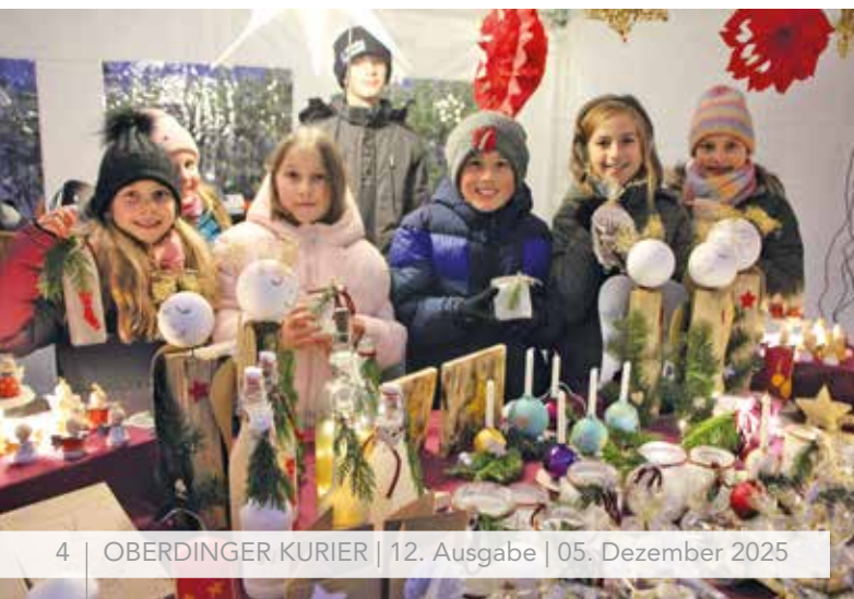
Plätzchen und weihnachtliche Deko – gebacken und gebastelt von den Oberdinger Ministrantinnen und Ministranten