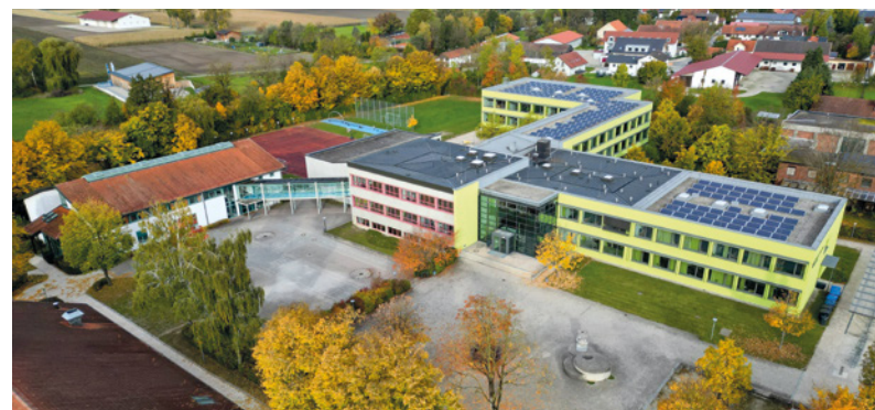
Staatliche Realschule Oberding (2025)