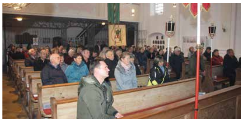
Volles Haus bei der Kirchenführung in St. Martin