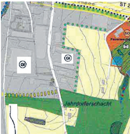
Flächennutzungsplan genehmigter Stand

Der Stadtrat hat am 01.07.2024 das Deckblatt Nr. 121 zum Flächennutzungsplan der Stadt Hauzenberg festgestellt. Das Deckblatt Nr. 121 zum Flächennutzungsplan ist Grundlage für den vorhabenbezogenen Bebauungsplan „SO Solarpark Jahrdorferschacht“ auf dem Grundstück Flur-Nrn. 184 Gemarkung Jahrdorf. Das Landratsamt Passau genehmigte das Deckblatt mit Bescheid vom 06.09.2024. Nach § 6 Abs. 5 Satz 1 BauGB ist die Erteilung der Genehmigung ortsüblich bekanntzumachen. Mit der Bekanntmachung wird die Flächennutzungsplanänderung nach § 6 Abs. 5 Satz 2 BauGB wirksam.