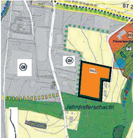
Flächennutzungsplan Deckblatt 121 Bereich Solarpark

ÄNDERUNG DES FLÄCHEN- NUTZUNGSPLANES MIT DECKBLATT NR. 121 (SO SOLARPARK JAHRDORFER- SCHACHT); Bekanntmachung der Genehmigung nach § 6 Abs. 5 BauGB