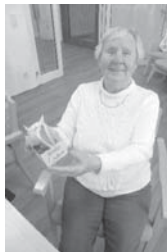
Besuch aus Heroldsbach