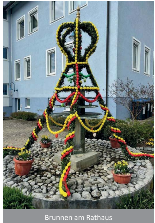
Brunnen am Rathaus