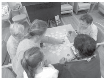
Besuch aus Hausen