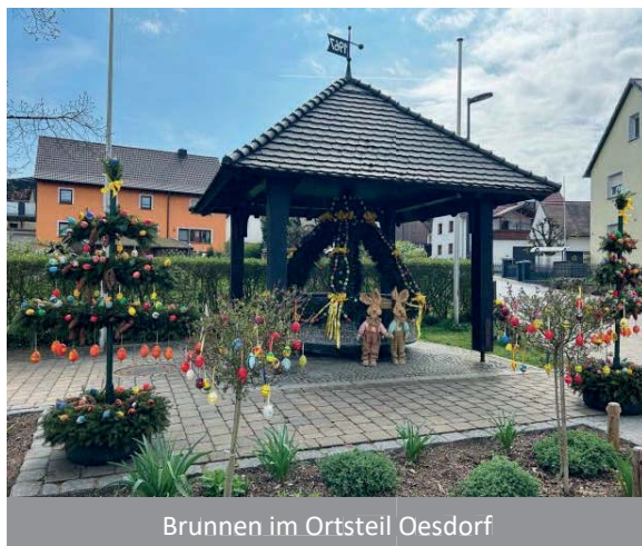
Brunnen im Ortsteil Oesdorf

Altes Brauchtum wird fortgeführt... Die Brunnen in unserer Gemeinde Heroldsbach erstrahlen in österlichem Glanz!