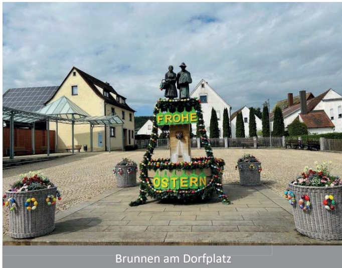
Brunnen am Dorfplatz