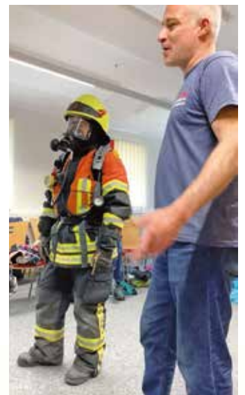
Keine Angst! So sieht in Feuerwehrmann aus, wenn er in ein brennendes Haus kommt.