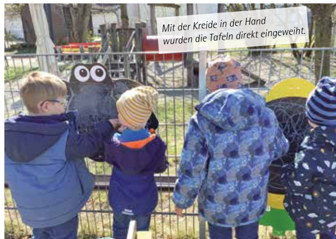
Mit der Kreide in der Hand wurden die Tafeln direkt eingeweiht.