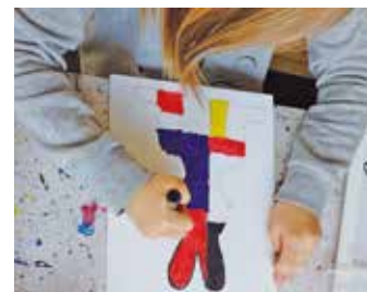
Leni malt das Bild von Piet Mondrian.

Mit einer selbstgestalteten Einladungskarte erhalten die Eltern der Vorschulkinder im Anschluss eine Einladung zu unserer Vernissage im Atelier. Hierbei werden die Kunstwerke der Kinder vorgestellt und die Eltern bekommen Einblicke in die Arbeit ihrer Kinder.