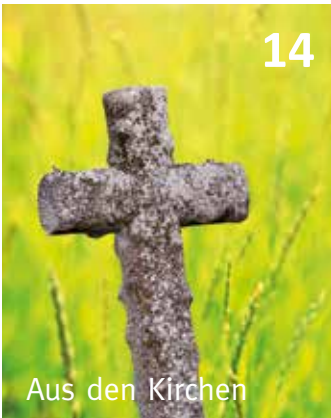
Aus den Kirchen