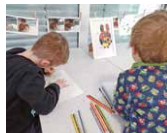
Skizze für Kunst trifft Osterhase.

Das Kinderhaus „Hand in Hand“, welches die Philosophie nach einer von Reggio – inspirierten Kultur des Lernens im Alltag lebt, möchte den Kindern darüber hinaus Inspirationen bieten. Die Großen lernen Bilder verschiedener weltweit bekannten Künstler kennen, welche sich ebenfalls mit der Thematik mit dem „Hasen“ auseinandergesetzt haben. Deren individuellen Kunstwerke werden den Kindern vorgestellt. Jedes Kind hat nun die Möglichkeit, das Kunstwerk durch eine Skizze selbst auf Papier zu bringen, be-