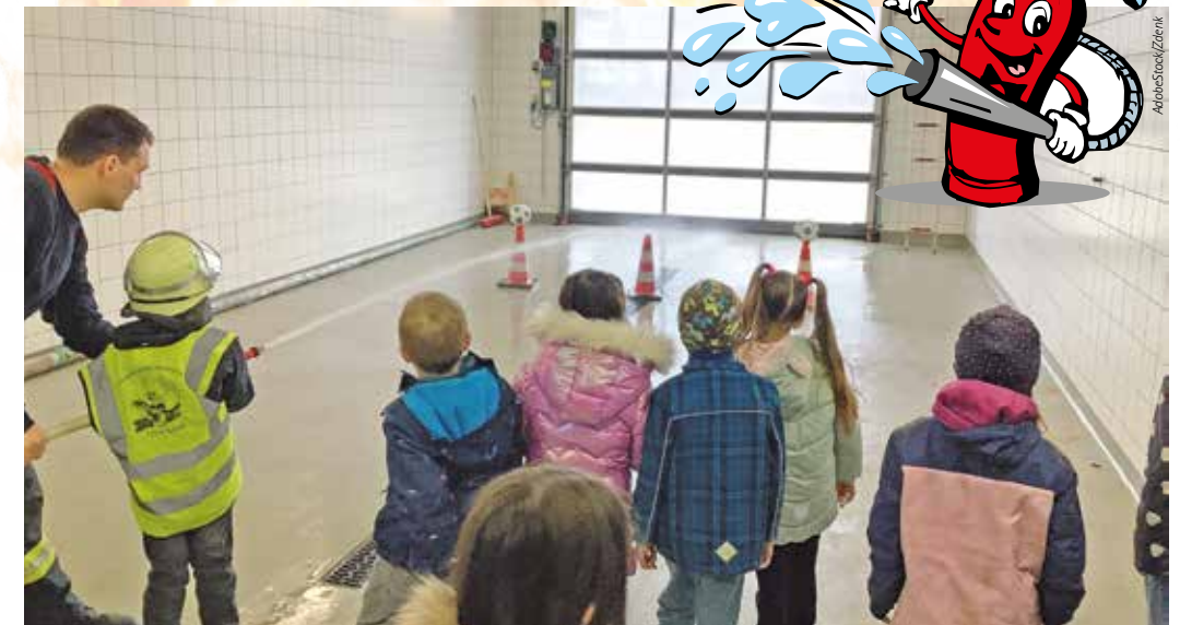
Im Feuerwehrhaus übten die Kinder das Zielen mit dem Wasserschlauch.

Im Selbstversuch lernten die Kinder, wie sie eine Kerze mit dem Streichholz richtig anzünden. Ganz wichtig: