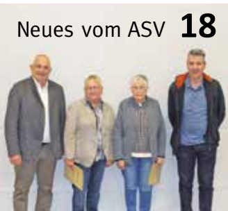
Neues vom ASV