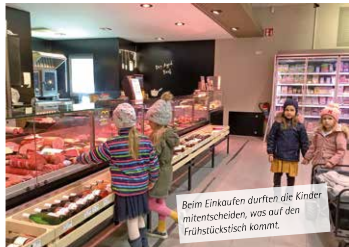
Beim Einkaufen durften die Kinder mitentscheiden, was auf den Frühstückstisch kommt.

Das Team aus dem Haus des Kindes bedankt sich ganz herzlich bei dem Elternbeirat für die tollen Ostergeschenke, das Frühstück und darüber hinaus für die Unterstützung und gute Zusammenarbeit. ■