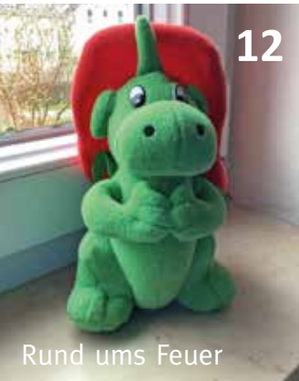
Rund ums Feuer