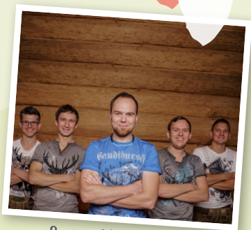
Spitz af Knopf

Für die Kinder kommt das Oberbayerische Marionetten-Theater mit „ Hänsel und Gretel “ ins Festzelt.