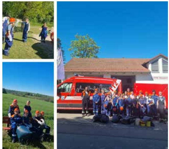
Grafik / Foto / Text: FF Stepperg

Ende April machten sich insgesamt 18 Jugendliche der Freiwilligen Feuerwehr Stepperg mit ihren Betreuern zu einer besonderen Übungseinheit auf. Unter dem Motto „Schützen“ wurde eine Müllsammelaktion zum Schutze unserer Natur im Bereich des Antoniberges, der Hartlbergallee, des gemeindlichen Spielplatzes im Neubaugebiet sowie am Hatzenhofener Weiher durchgeführt. Insgesamt wurde Unrat im Volumen von fast 300 Litern zusammengetragen. Ein herzliches Dankeschön den fleißigen Helfern und an die Gemeinde Rennertshofen für die Bereitstellung der Restmüllbehältnisse.