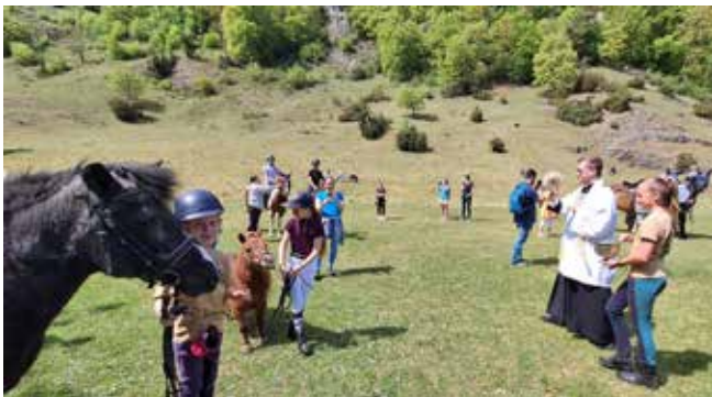
Grafik / Foto / Text: PSG Altmühltal

Ein herzliches Dankeschön ergeht an Herrn Pfarrer Huber, der sich wieder mal für die Pferdesegnung Zeit genommen hat und an unsere fleißigen Kuchenbäcker /-innen.