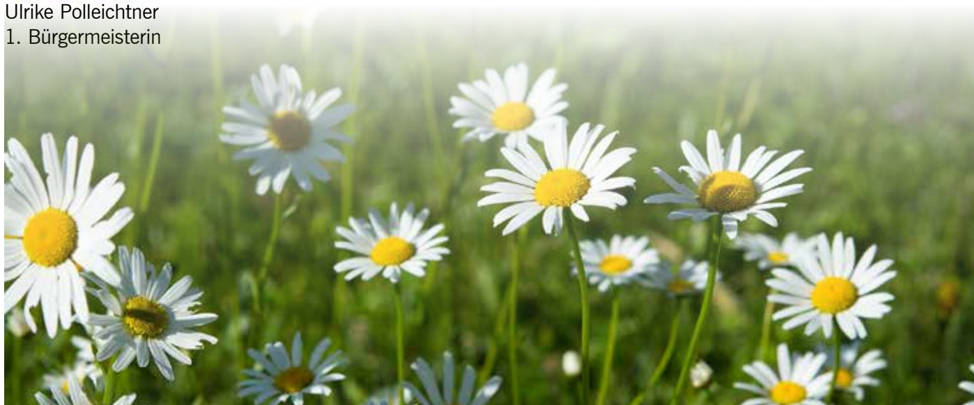
Ulrike Polleichtner 1. Bürgermeisterin

A handwritten signature in blue ink that reads "U. Polleichtner".