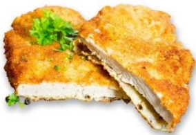
Schnitzel mit Pommes oder Kartoffelsalat und gemischten Salat