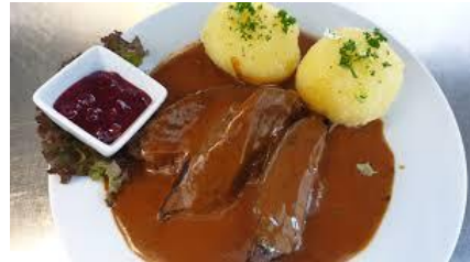
Sauerbraten mit Klößen und Blaukraut