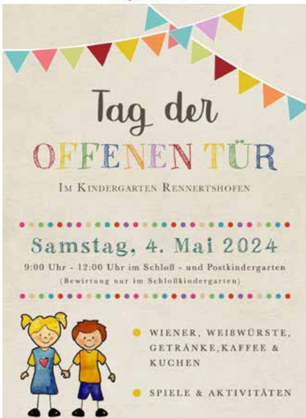
Grafik / Text: Kindergarten Rennertshofen