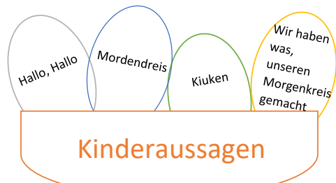
Grafik / Fotos / Text: Kinderkrippe Rennertshofen