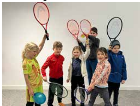
Einige Tenniskinder in der Rennertshofener Turnhalle.

Mitte/Ende März 2026: Plätze herrichten (Mitglieder werden über die genauen Arbeitseinsätze informiert)