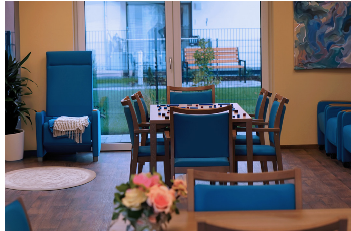
Räumlichkeiten der Tagespflege In einer gemütlichen Atmosphäre wird gemeinsam gelacht, gespielt und geruht.

Wir nehmen uns Zeit für Sie! Besonderen Wert legen wir auf eine persönliche und liebevolle Betreuung - unsere erfahrenen Mitarbeiterinnen und Mitarbeiter kümmern sich individuell um jeden einzelnen Gast. Wenn es erforderlich ist, übernehmen wir auch die notwendige Behandlungspflege nach ärztlicher Verordnung, z. B. Medikamentengabe. Weitere pflegerische Unterstützung können Sie auf Anfrage bei unserem ambulanten Pflegedienst erhalten.