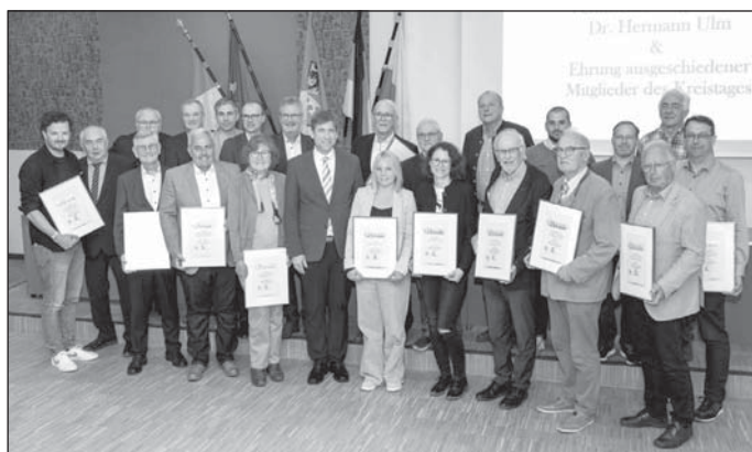
„Verabschiedung Kreisräte“

Auszug aus der Pressemitteilung Nr. 102/2026