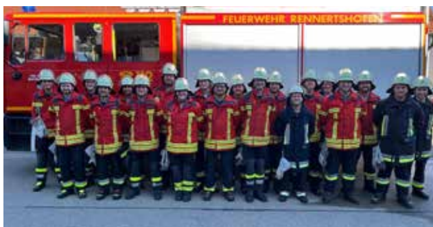
Grafik / Foto / Text: FF Rennertshofen