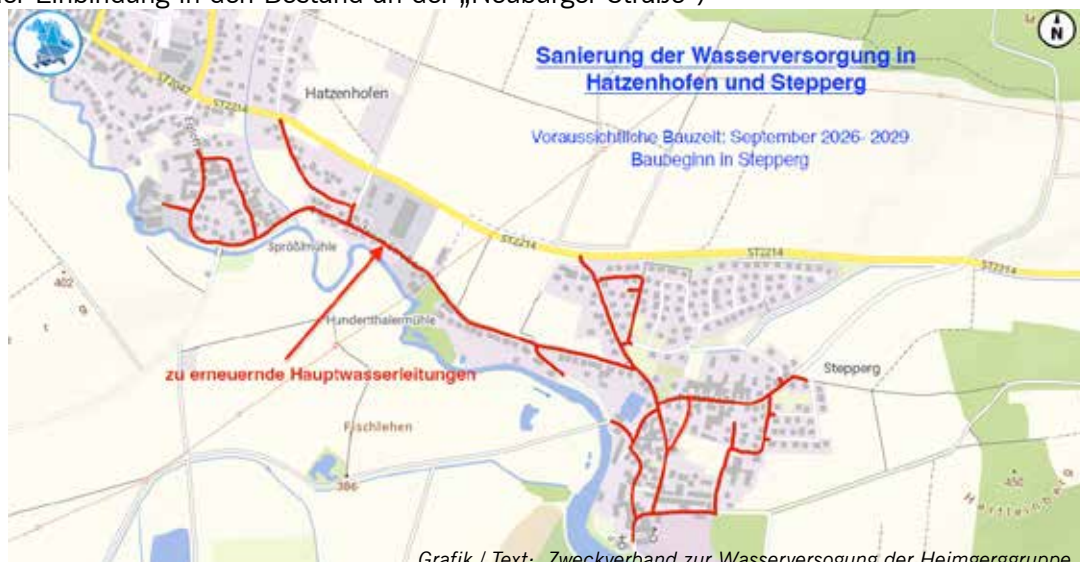
Grafik / Text: Zweckverband zur Wasserversorgung der Heimberggruppe