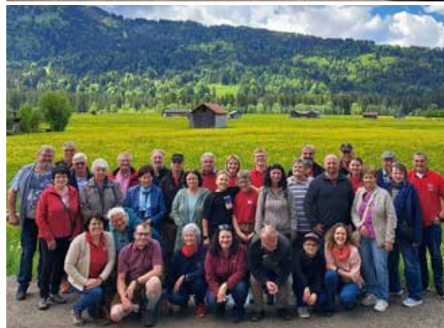
Grafik / Foto / Text: FF Stepperg