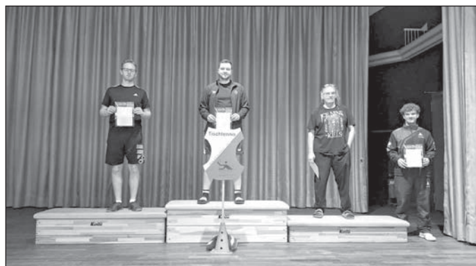
Das Treppchen beim jüngsten Race-Turnier

Die Tischtennisabteilung der SpVgg/DJK Heroldsbach/Thurn hat ihr erstes Race-Turnier der Saison 2026 ausgerichtet. Neben fünf eigenen Spielern konnten zehn Sportler aus der näheren und weiteren Umgebung begrüßt werden. Bei Race-Turnieren treten bis zu 16 Spielerinnen und Spieler in sechs Runden gegeneinander an, je nach Platzierung können Race-Punkte gesammelt werden. Besonders freut uns, dass unser eigenes Nachwuchstalent Jonas Lang den vierten Platz erreichen konnte.