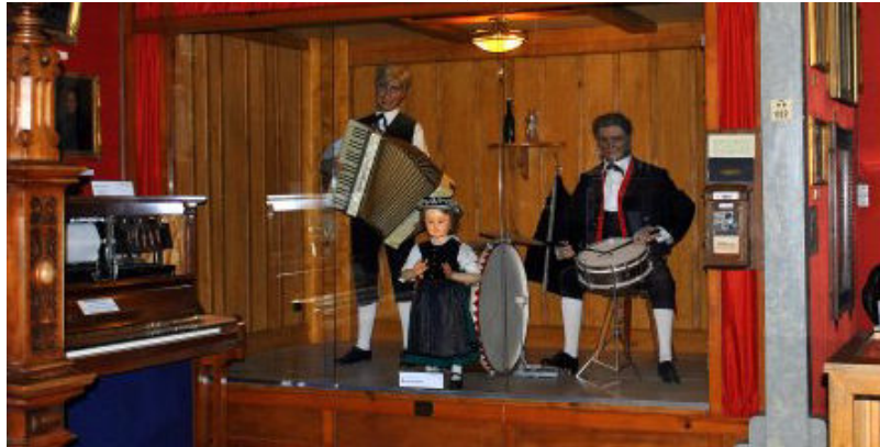
Halt bei der Hinfahrt zur Besichtigung des Schwarzwaldmuseum - Triberg