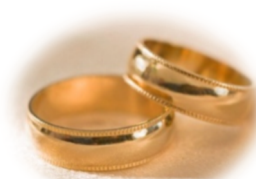
generiert: Elfriede Dull mit adobe firefly

Termin: Samstag, 17. Januar 2026 Zeit: 9:00-16:00 Uhr (Mittagspause: 1,5 h gemeinsames Mittagessen optional) Ort: Neutraubling, Pfarrsaal, Schlesische Str. 2 Referenten: Religionslehrerin i. K. Andrea Stadler und Diakon Manuel Hirschberger Anmeldung: info@keb-regensburg-land.de Tel.-Nr. per Rückfragen: 0176/62023104