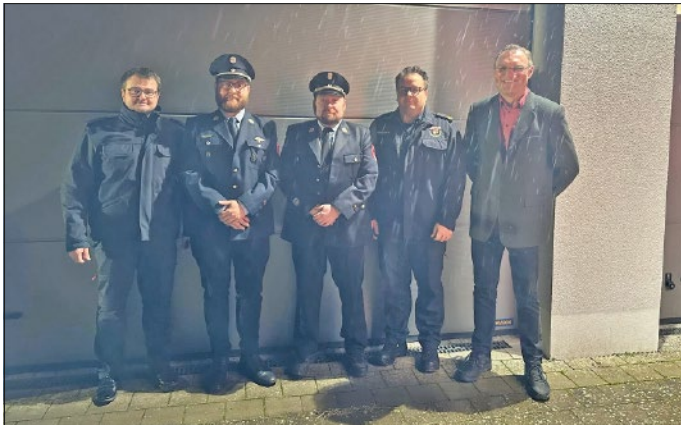
Gruppenbild Kommandantenwahl Hainert

Mit der Aufnahme von drei neuen Mitgliedern und den Worten „Gott zur Ehr, dem Nächsten zur Wehr“ wurde die Versammlung beendet.