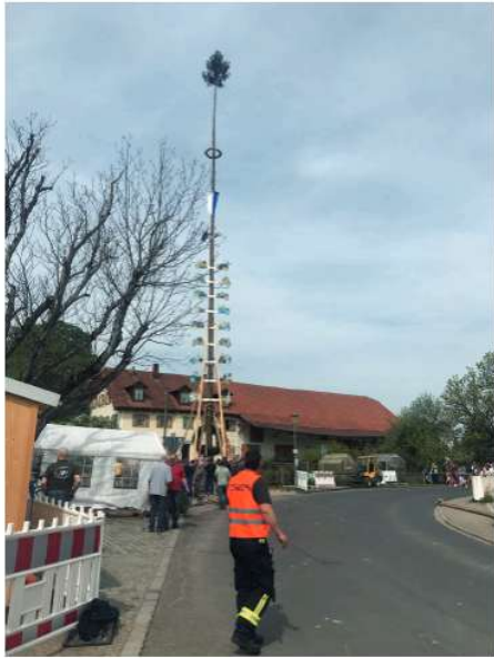
2025 neuer Standort am Gästehaus Neubauer vor dem Saler-Anwesen