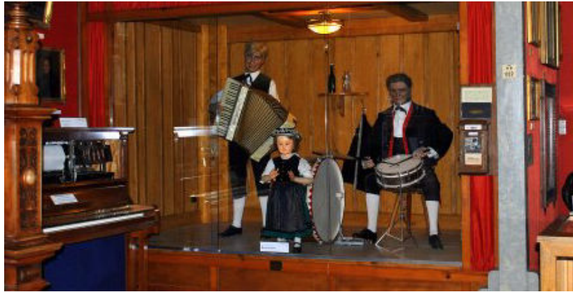
Halt bei der Hinfahrt zur Besichtigung des Schwarzwaldmuseum - Triberg