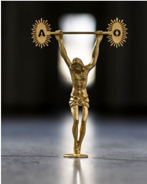
Er reißt die Welt empor - ein Objekt von Werner Hofmeister 2018

Im Urlaub bin ich diesem Bild das erste Mal in einem Gemeindebrief begegnet. Mich hat es sofort angesprochen und es hat mich berührt.