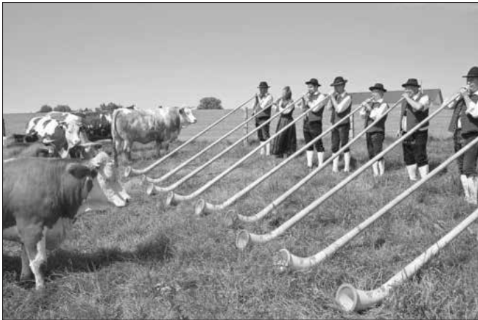
Alphorn-Bläserinnen und -bläser aus Walkertshofen (Landkreis Augsburg)