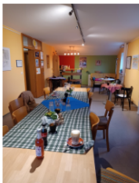
Im Tageszentrum Prisma finden psychisch kranke Menschen soziale Kontakte und Tagesstruktur.

Viele Betroffene , aber auch deren Angehörige brauchen professionelle Unterstützung. Letztes Jahr suchten etwa achthundertfünfzig Bürger aus dem Landkreis Erding Hilfe bei unserem Dienst. Wir sind in Erding und Dörfen zu finden und schauen gemeinsam mit den Betroffenen oder ihren Angehörigen, was