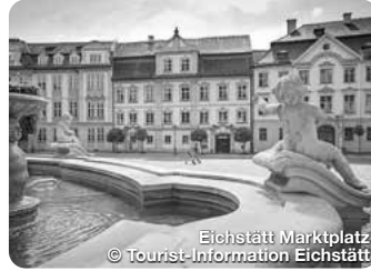
Eichstätt Marktplatz