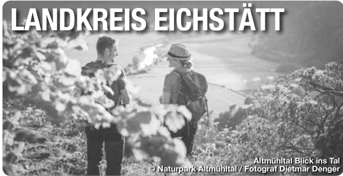
Altmühltal Blick ins Tal

Alle Termine und Angaben unter Vorbehalt!