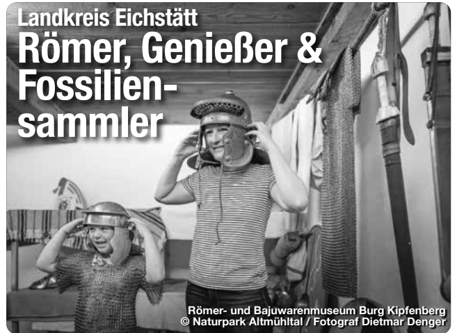
Römer- und Bajuwarenmuseum Burg Kipfenberg

Für Fossilien Sammler ist der Landkreis Eichstätt ein Eldorado. Die Gegend ist weltbekannt für ihre reichen Funde von Fossilien aus der Jurazeit. Die Römer am Limes haben ebenfalls ihre Spuren hinterlassen. Der Obergermanisch-Raetische Limes, UNESCO-Weltkulturerbe, verläuft durch den Landkreis. Historische Stätten wie das Kastell Vettoniana in Pfünz und das Römer und Bajuwarenmuseum in Kipfenberg bieten Einblicke in das römische Erbe der Region. Für Genießer locken