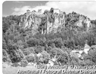
Burg Arnberg