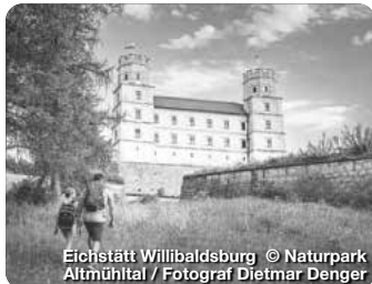
Eichstätt Willibaldsburg

TreffpunktDeutschland.de/eichstaett-region