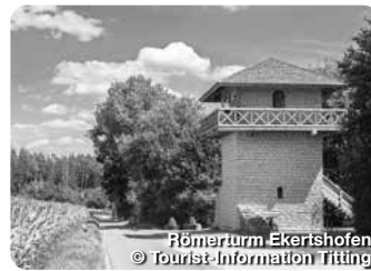
Römerturn Ekerthofen

Hier überraschen mehr als 70 Nachbildungen der Urzeitgiganten in Lebensgröße. Beim Fossilien schlagen in der Mitmachhalle gehen alle mit Hammer und Meißel auf die Suche nach echten Versteinerungen. Dinopark 1, Denkendorf