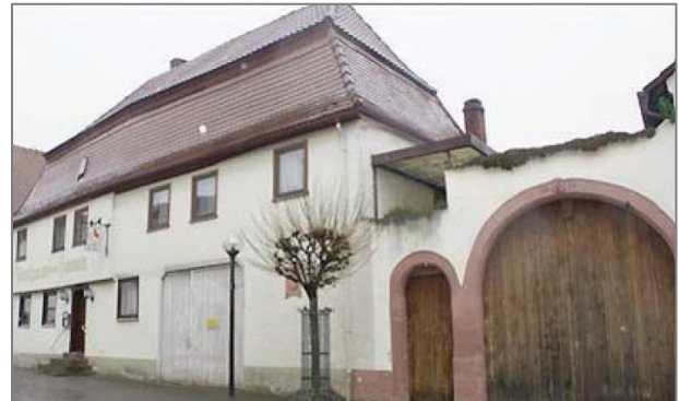
Fotos: Das Gasthaus „Zum Hasen“ vor der Sanierung (rechts) und nach den Maßnahmen (links).