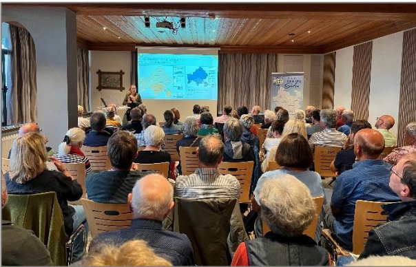
Hohe Nachfrage: Informationen zum Thema gemeinschaftliche Wohnformen erhielten rd. 70 Besucher in der Deutschherren-Halle in Gelchsheim.