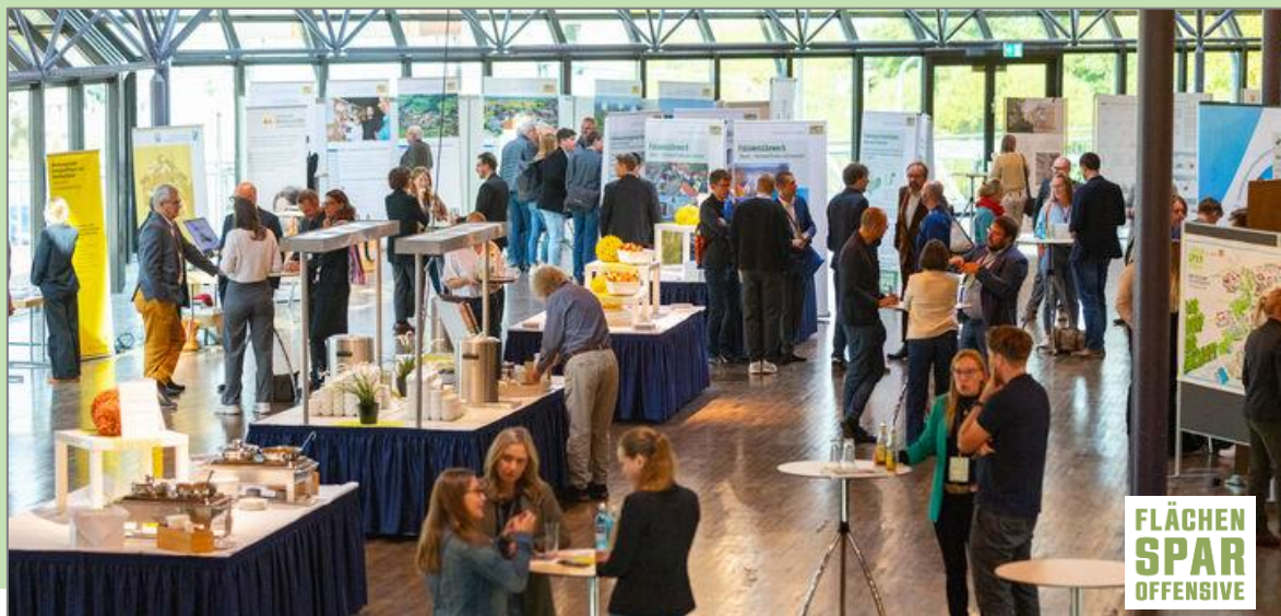
Beim Kongress der Flächensparoffensive wurden im Ausstellungsbereich Kontakte geknüpft und Informationen ausgetauscht.