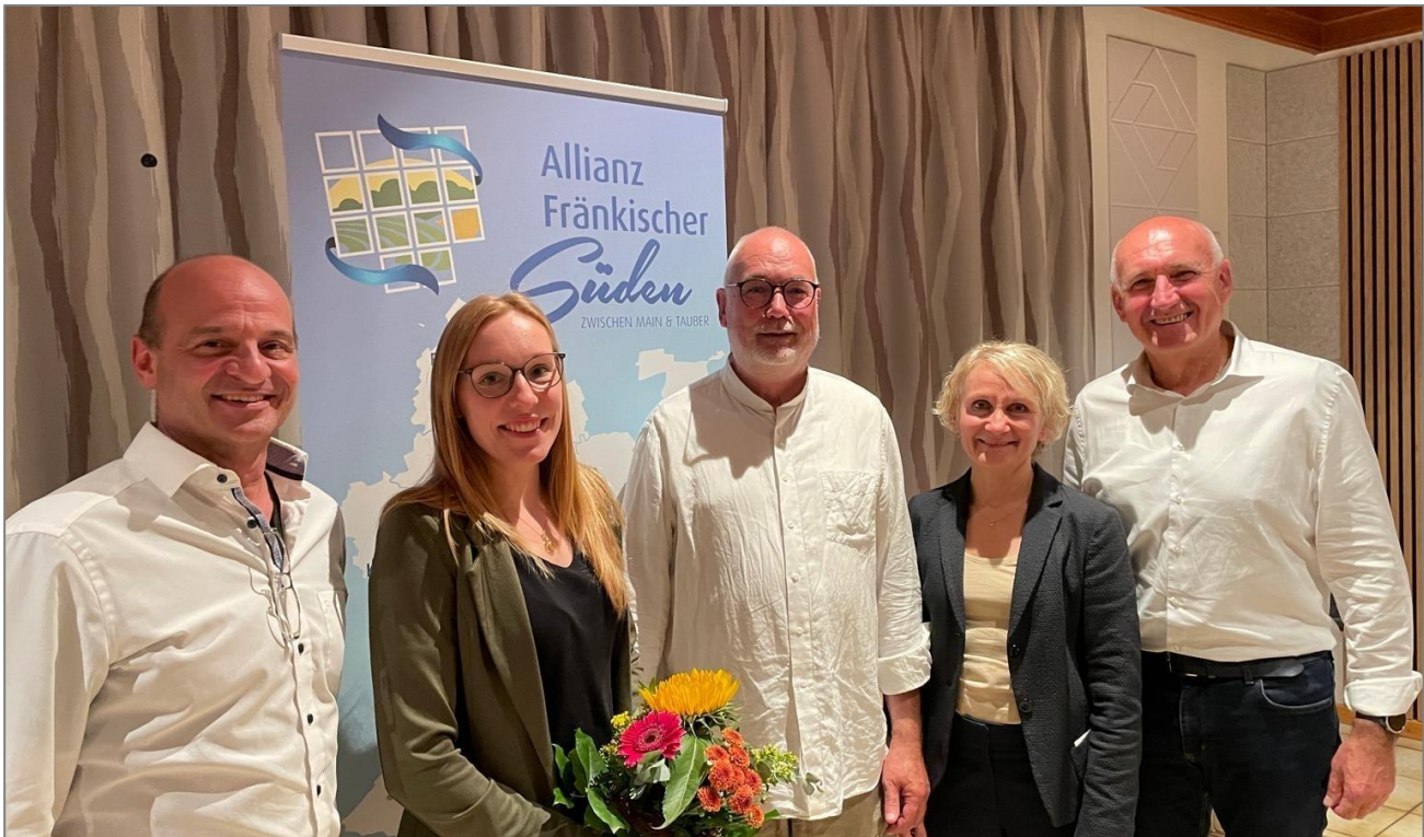
Referenten und Organisatoren des Themenabends in Gelchsheim.