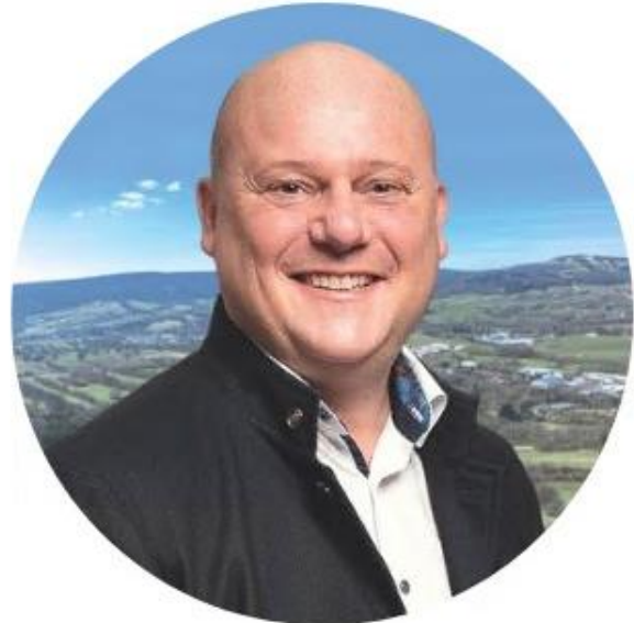
Foto: Georg Seiffert, Erster Bürgermeister der Stadt Bischofsheim in der Rhön und Vorsitzender der Kreuzbergallianz.

Georg Seiffert: Nachdem die Stadt Bischofsheim bereits ein Leerstandskataster erstellt hatte, wurde nach der Gründung der ILE Kreuzbergallianz im Jahr 2010 als erste Maßnahme zur Orts- und Siedlungsentwicklung eine flächendeckende Erhebung von Leerständen und vorhandenem Bauland im gesamten Allianzgebiet mit Unterstützung eines Büros und Förderung durch das Amt für Ländliche Entwicklung umgesetzt. Diese Datengrundlage wurde intensiv analysiert und vor allen Dingen wurden die Leerstände und Flächen mit dem prognostizierten Bedarf abgeglichen. Allein die vorhandenen Flächenreserven in den Allianzgemeinden waren jeweils erheblich höher als der Bedarf. Mit