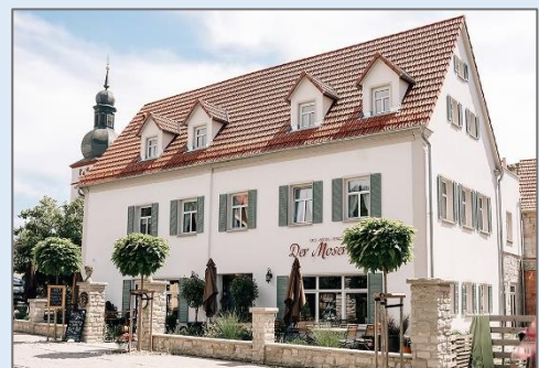
Fotos: Altes Gasthaus Moser in Trossenfurt wurde zum modernen Moserhof umgebaut.