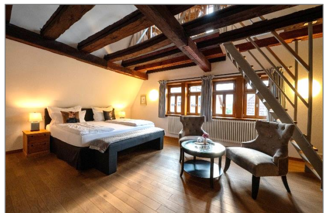
Foto: Gemütliches Doppelzimmer im Dachstuhl des Landgasthofs.

Die Gesamtkosten für die angefallenen Baumaßnahmen beliefen sich auf ca. 2,4 Mio. €. Daran beteiligte sich die Städtebauförderung aus Mitteln des sog. „Zentrenprogramms“ mit 720.000 €. Zudem erhielt der Markt Kleinwallstadt im Jahr 2016 einen Förderpreis der Kulturstiftung des Bezirkes Unterfranken zur Erhaltung historischer Bausubstanz in Höhe von 25.000 €.