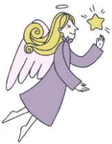
Zeile oben: Die Räume erstrahlen in neuem Glanz.