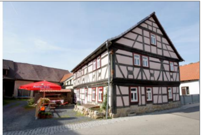
Ein Gebäudebeispiel von mittlerweile vielen, die den Sanierungspreis der Kreuzbergallianz gewonnen haben: Die kleine Speise- und Schankwirtschaft „Einst“ in Ginolfs. Links im Ursprungszustand, rechts nach aufwändiger Renovierung.