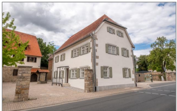
Beachtlicher Vorher-Nachher-Vergleich: Oben das Pfarrhaus vor der Sanierung, unten im Zustand danach. Quelle: Architekturbüro Sabine Kunert