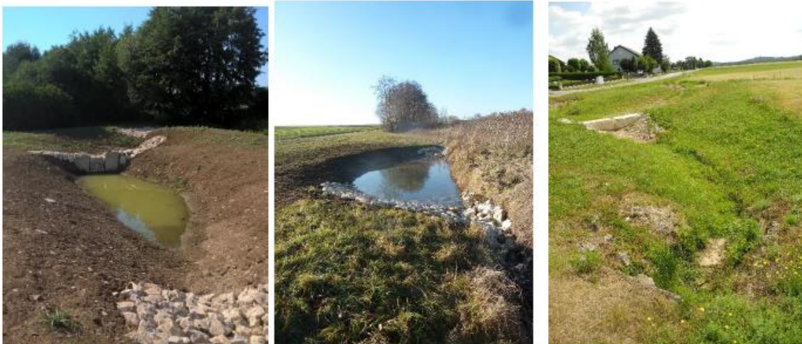
Beispielbilder/Schemata Sandfänge (alle vom Einzugsgebiet Felchbach)

Die Ausgestaltung der Sandfänge ist im Prinzip immer gleich – eine Aufweitung mit etwa 3 bis 5 Metern Breite und etwa 15 Metern Länge im Bereich nicht dauerhaft wasserführender Zuflüsse, der Abfluss begrenzt mittels Schlitzdrossel oder Wasserbausteinen oder Kies – kann jedoch von Ort zu Ort aufgrund der verschiedenen Rahmenbedingungen unterschiedlich ausfallen.