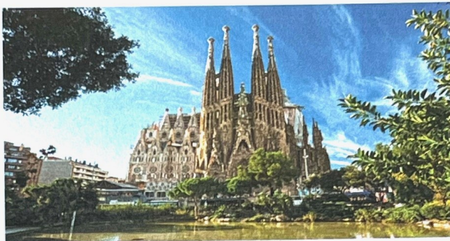
Sagrada Familia, Barcelona