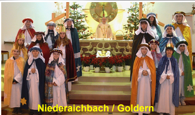
Niederaichbach / Goldern

Allen Eltern, Begleitern, Autofahrern, Helferinnen und Helfern möchte ich im Namen der Pfarrei Vergelts Gott für die Betreuung der Kinder sagen! Vergelt's Gott besonders allen Wohltätern und Spendern!