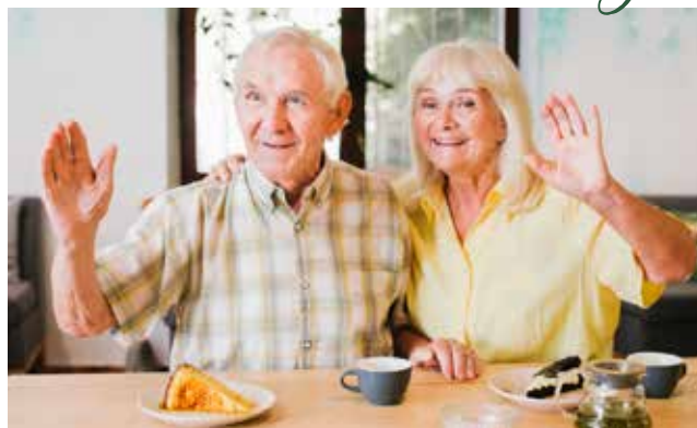
im Kath. Jugendheim in Karlshuld