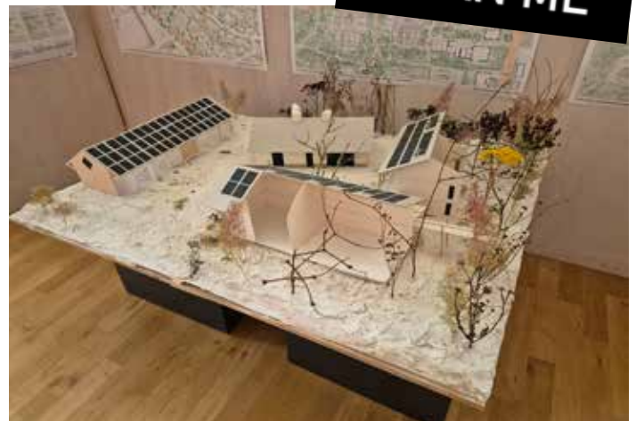
Projektfavoriten „Zamm wachsn“ (oben) und TRIHUSES (unten)