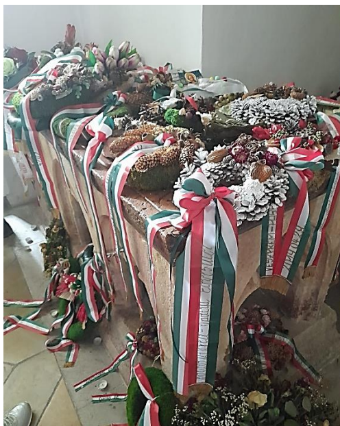
Abbildung 4: Grab der seligen Gisela

Sylvia Erhard, eine ehemalige Klosterschülerin, gab Einblicke in die Geschichte des ältesten Passauer Klosters. Sie erzählte von den Nonnen, die nach den Regeln des heiligen Benedikt lebten und den Kaisern, die das Kloster zur Reichsabtei erhoben hatten. Sie erläuterte auch die Bedeutung des Klosters im Salzhandel und die historischen Wechsel der Besitzverhältnisse.