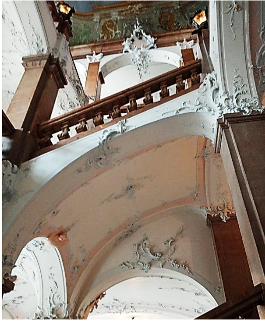
Abbildung 5: Dachbalustrade und dem kunstvollen Stiegenhaus

Hauzenberg Haag Germannsdorf Oberdiendorf