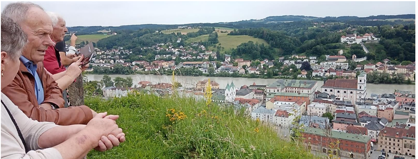
Abbildung 1 Veste Oberhaus