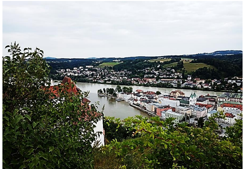
Abbildung 10: Blick Donau - Inn

Nach einem Rundgang durch die Außenanlagen der Festung genossen die Teilnehmer den einzigartigen Blick auf die Dreiflüssestadt Passau und den Zusammenfluss von Donau, Inn und Ilz.