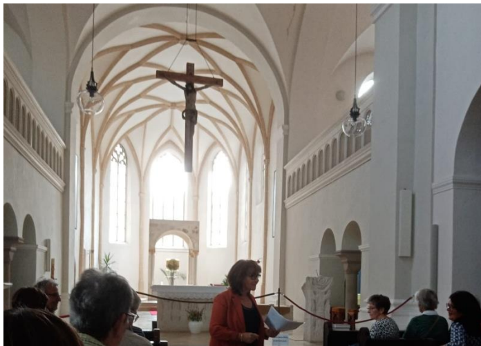
Abbildung 2 Kloster Niedernburg

Nach der Ankunft am Römerplatz ging es zum Kloster Niedernburg, wo das „Grab der seligen Gisela“ besichtigt wurde.