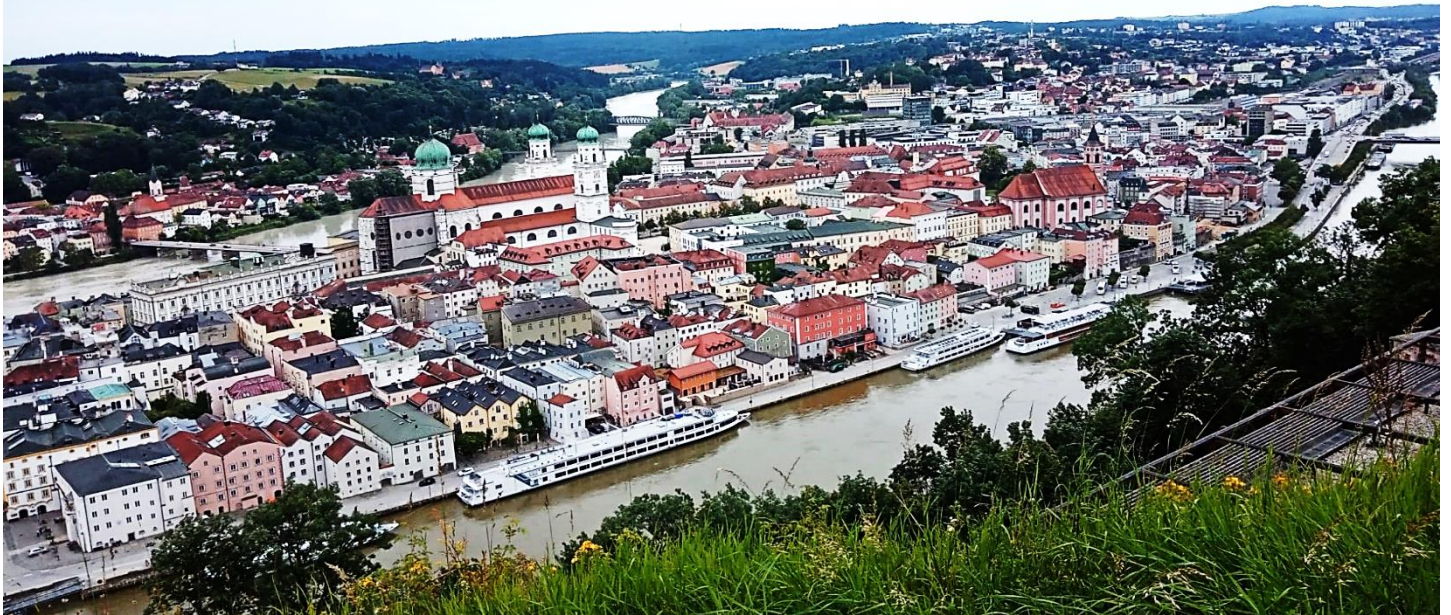
Abbildung 8: Blick auf Passau von Veste Oberhaus

Hauzenberg Haag Germannsdorf Oberdiendorf