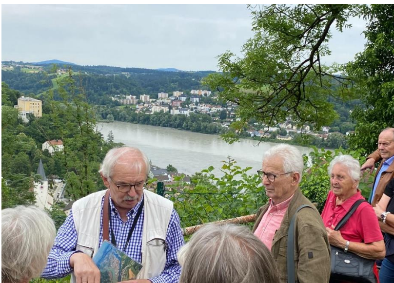
Abbildung 9: Der Stadtführer erzählt die Geschichte Passau der Stadt

Der nächste Programmpunkt war die Fahrt zur Veste Oberhaus. Die Teilnehmer erhielten eine kurze historische Einführung von zwei Stadtführern.