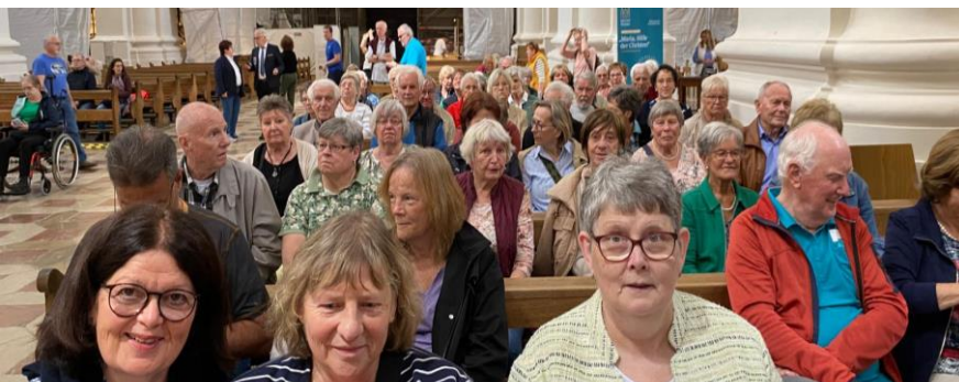
Abbildung 7: Orgelkonzert im St. Stephan Dom

Mit ihren 17.974 Pfeifen und 233 Registern, die von einem Hauptspieltisch aus gemeinsam gespielt werden können, ist sie die größte katholische Kirchenorgel der Welt und die größte Orgel Europas. Aufgrund einer Restaurierung konnte jedoch die volle Klangwirkung nicht erlebt werden.