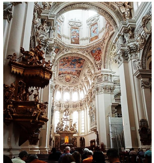
Abbildung 6: St. Stephan Dom