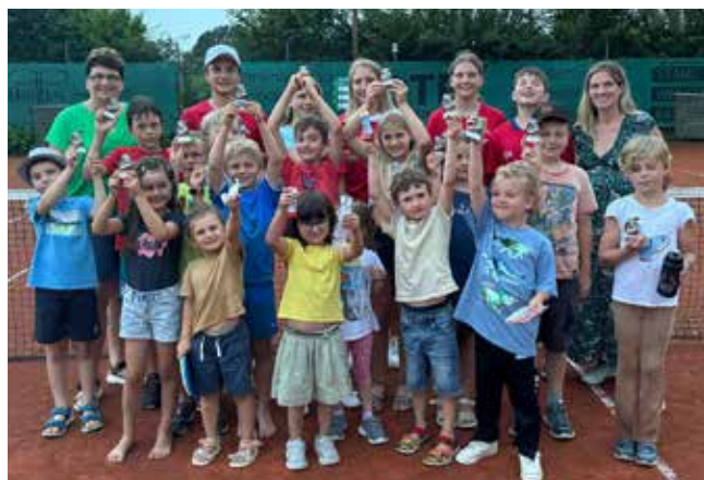
Die glücklichen TCR-Kinder mit ihren Pokalen und Geschenken.

Im September finden noch ein paar Trainingseinheiten statt und es darf auch weiterhin bis zur Platzeinwinterung Ende Oktober/Anfang November fleißig Tennis gespielt werden.