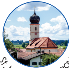
St. Martin, Steingau