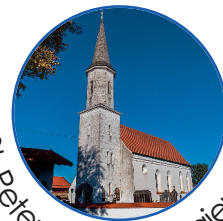
St. Peter und Paul, Baiernrain