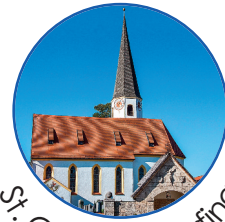
St. Georg, Otterfing