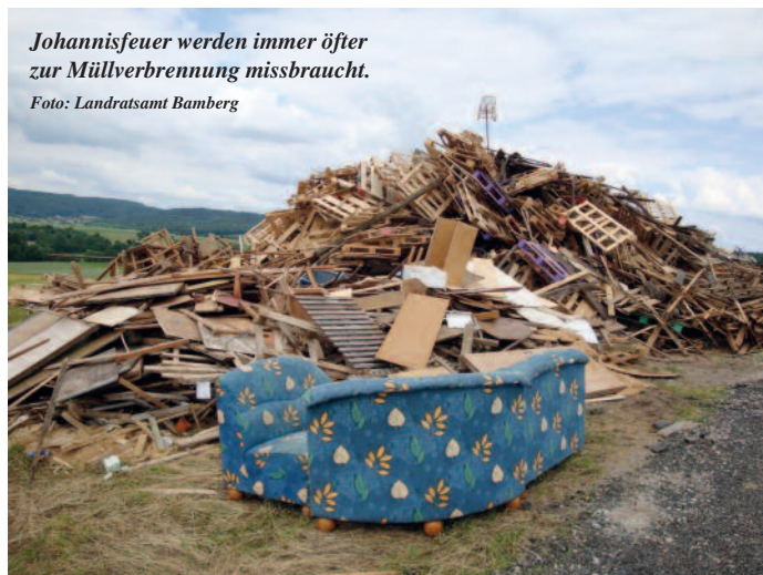
Johannisfeuer werden immer öfter zur Müllverbrennung missbraucht.

Als Brennmaterial darf ausschließlich unbehandeltes Holz verwendet werden. Holzreste mit Farben, Lacken oder Lasuren gehören ebenso wenig ins Feuer wie Kunststoffe, Sperrmüll oder alte Reifen. Wer bei Johannisfeuern Müll verbrennt oder dies zulässt, begeht eine Ordnungswidrigkeit, die mit einem Bußgeld geahndet werden kann.