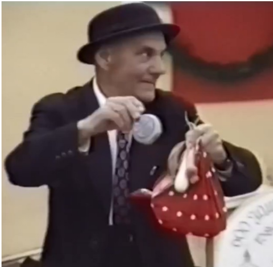
Der „Ottl“ auf der 600-Jahr-Feier des Marktes Tann im Jahr 1989 12