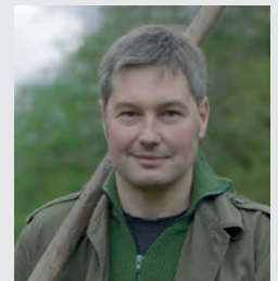
Oliver Speck Von puffenden Meilern und glühenden Kohlen.