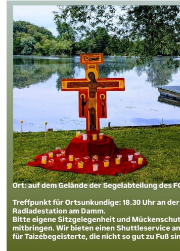
Ort: auf dem Gelände der Segelabteilung des FCT

Wir dürfen wie im letzten Jahr auf dem Gelände der Segelabteilung des FCT an der Almer Grube zu Gast sein, und zwar am Sonntag, 21. Juni 2026 um 19:00 Uhr . Taizé-Begeisterte, die nicht mehr so gut zu Fuß sind oder den Weg nicht kennen, treffen sich bereits um 18:30 Uhr an der E-Bike-Ladestation (Infopoint