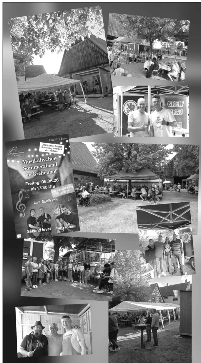
Musikalische Grüße, Gesangverein Hausen

Ein herzliches Dankeschön gilt allen Besucherinnen und Besuchern, die durch ihr Kommen unsere Veranstaltung und den Verein unterstützt haben. Ebenso danken wir allen Helfern, die mit ihrem Einsatz und guter Laune – sei es bei den Vorbereitungen, beim Kuchen backen, beim Auf- und Abbau, in der Küche, beim Ausschank oder im Service – zum Gelingen dieser beiden Feste beigetragen haben. Ohne so großes ehrenamtliches Engagement wären solche Veranstaltungen nicht möglich.