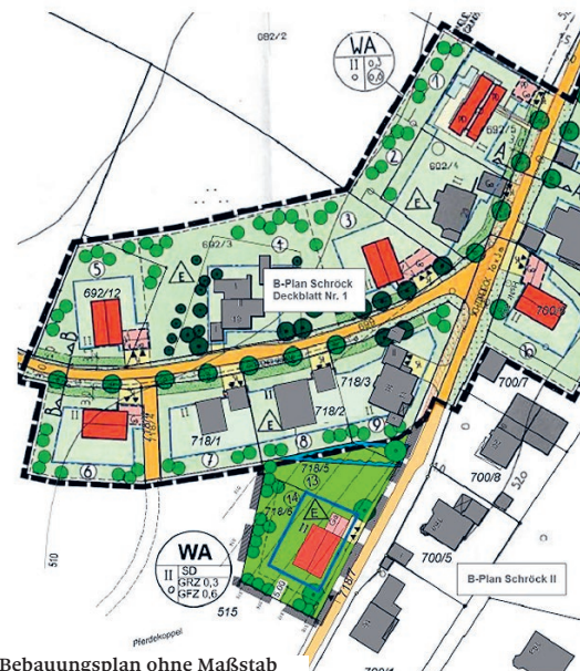
Bebauungsplan ohne Maßstab

Der Stadtrat hat am 04.12.2023 beschlossen den Bebauungsplan „WA Schröck“ zu erweitern. Mit der Bauleitplanung sollen die Flurnummern 718/6, 718/7 und 718/5 jeweils Gemarkung Jahrdorf in den Bebauungsplan mitaufgenommen werden, um dort ein Einfamilienhaus mit Doppelgarage zu errichten.