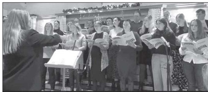
gemeinsamer Auftritt Männerchor und KlangALLEe