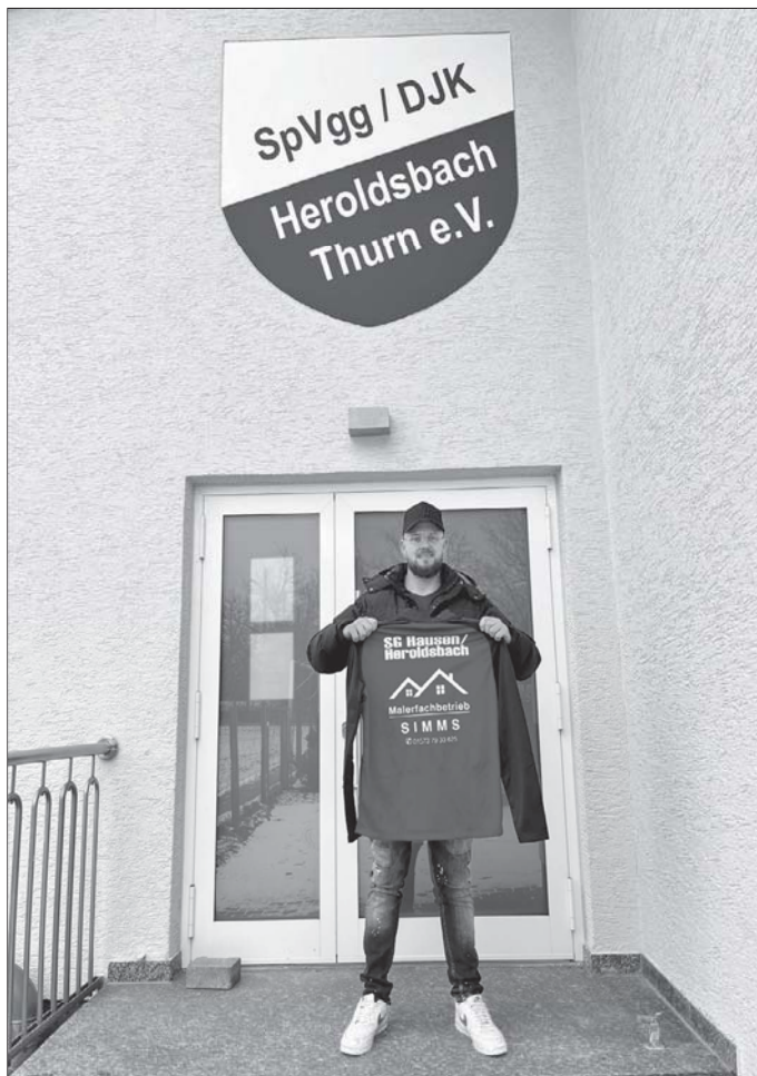
DJK SC Oesdorf