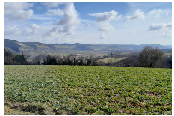
Blick ins Maintal

»Panoramaweg in Laudenbach« - Jüdische Vergangenheit in Franken