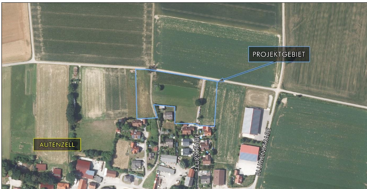
Abb. 1: Lage des Projektgebietes (hellblau markiert) mit hinterlegtem aktuellem Luftbild.

Gegenstand der Luftbild- und Aktenauswertung ist ein etwa 13.500 m 2 großes Areal im Norden von Autenzell im oberbayerischen Landkreis Neuburg-Schrobenhausen (vgl. Abb. 1).