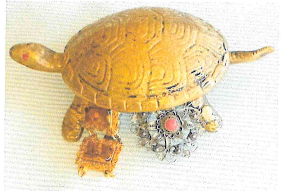
„ Kaplumbağa “

„ Kannst Du Dich noch an die Schildkröte erinnern? “, fragte ich weiter. Die mittlerweile silbrig ergraute Mutter begann zu lachen und zu weinen. Unser beider Freude war groß. Ausgerechnet das Symboltier für Langsamkeit und vierbeinige Unmobilität hatte uns zwei nach 45 Jahren eingeholt.