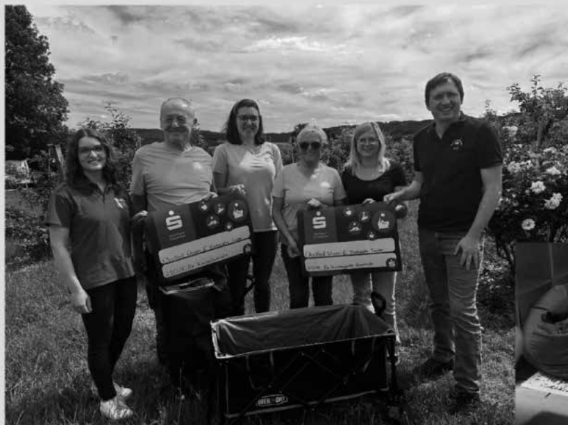
Sitzsäcke in der Kindertagesstätte Kunreuth

Die Kindertagesstätte Kunreuth sowie die Kinderfeuerwehr Kunreuth haben eine Spende von je 250,00 € erhalten. Ein großer Dank geht an den Obsthof Erlwein und die Fischzucht Sailer sowie an alle, die beim Adventstürchen im vergangenen Jahr am Obsthof Erlwein gespendet haben. Die Kindertagesstätte hat das Geld in vier Sitzsäcke für den Eingangsbereich investiert und die Kinderfeuerwehr Kunreuth hat sich von dem Geld zwei Bollerwägen gekauft und ist für künftige Ausflüge nun bestens ausgestattet. Außerdem wurden drei Fußbälle beschafft.